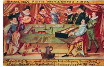
Ensemble instrumentale estudiantine (Breviaire de Johann Wilhelm Thenn, propriété privée)