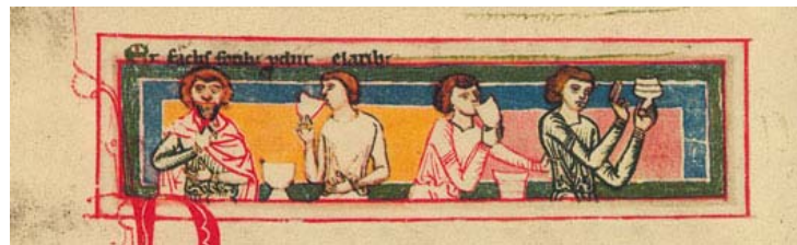
Miniature des quatre buveurs (Carmina burana, f. 89 v)