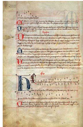
Oswald von Wolkenstein: «Her wiert, uns dürstet also sere» (Innsbrucker Hs., 1432, f. 29 v)